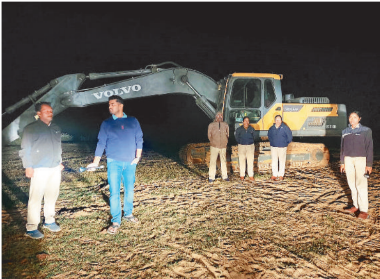
शामिल किसी भी व्यक्ति को बख्शा नहीं जाएगा। पार्यावरण संरक्षण हमारी प्राथमिकता है और यह अभियान सख्ती के साथ चलता रहेगा। प्रशासन और पुलिस की संयुक्त टीमों

राउरकेला। राउरकेला व आसपास क्षेत्र में अवैध रेत खनन पर लगातार कसने के लिए पुलिस ने बड़े पैमाने पर अभियान छेड़ दिया है। शनिवार को पूरे दिन- रात में पुलिस की ताबड़तोड़ कार्रवाई से बालू माफियाओं में हड़कंप मचा हुआ है। अभियान के दौरान दर्जनों वाहनों को पकड़ा गया, वहीं रेत तस्करी से जुड़े कई लोगों को हिरासत में लेकर कानूनी प्रक्रिया शुरू कर दी गई है। कोयल और ब्राह्मणी नदी के उन इलाकों में जहां अवैध खनन की शिकायतें अधिक मिल रही थीं, पुलिस ने विशेष निगरानी बढ़ा दी है। स्थानीय थानों की संयुक्त टीम लगातार गश्त कर रही हैं। नदी तटों से लेकर प्रमुख सड़कों पर नाका लगाकर वाहनों की जांच की जा रही है, जिससे अवैध रेत ढोने वालों पर लगातार लगाई जा सके। एसपी राउरकेला के अनुसार, अवैध रेत खनन के खिलाफ यह कड़ा अभियान आगे भी बिना किसी रियायत के जारी रहेगा। उन्होंने कहा, अवैध खनन में