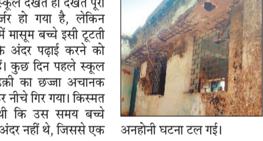
अनहोनी घटना टल गई।

रायगढ़। खरसिया ब्लॉक के ग्राम पंचायत भैनापारा के आश्रित गांव कलमी का प्राथमिक विद्यालय वर्तमान में खंडहर बन चुका है। शासन-प्रशासन की अनदेखी के कारण मजबूर बच्चे इसी जर्जर स्कूल में भविष्य गढ़ने को मजबूर हैं। 1993 में निर्माण हुए इस स्कूल की हालत काफी खराब हो चुकी है। यह स्कूल देखते ही देखते पूरी तरह जर्जर हो गया है, लेकिन मजबूरी में मासूम बच्चे इसी टूटती इमारत के अंदर पढ़ाई करने को मजबूर हैं। कुछ दिन पहले स्कूल की खिडकी का छज्जा अचानक भरभराकर नीचे गिर गया। किस्मत अच्छी थी कि उस समय बच्चे कक्षा के अंदर नहीं थे, जिससे एक अनहोनी घटना टल गई।