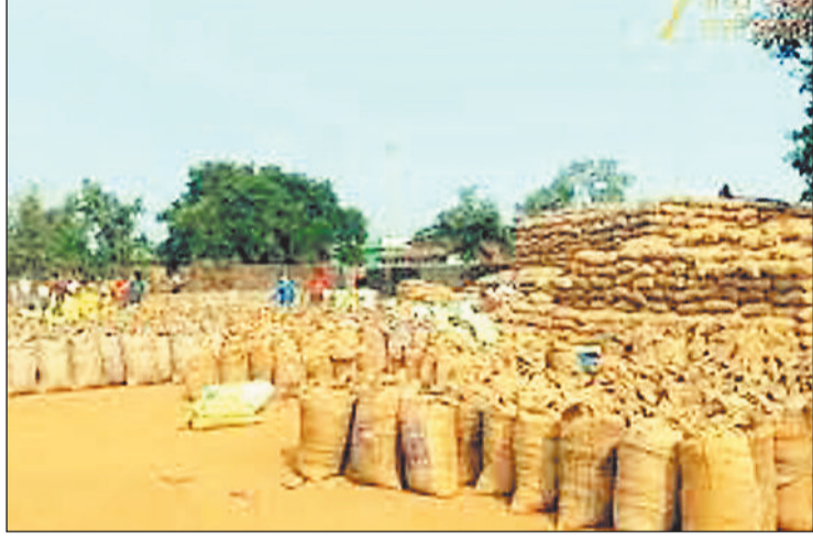
खरीदी केंद्र में धान।

अभी धान खरीदी में तेजी नहीं आई है। जानकारी के अनुसार अभी तक सिंचित 4 और असिंचित करीब 17 प्रतिशत ही धान