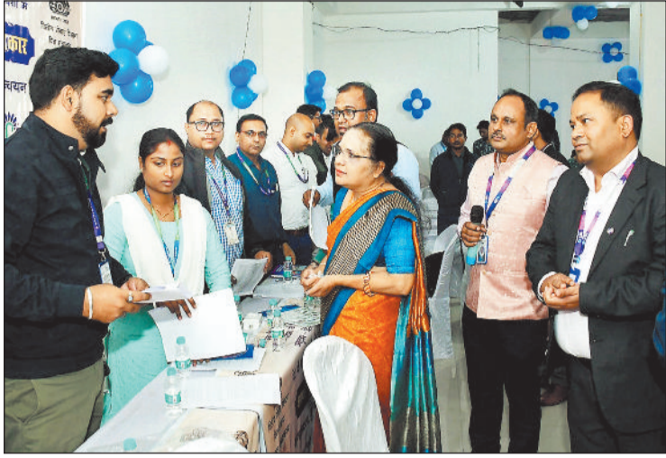
शिविर में हिताग्रहियों से चर्चा करते बैंक अधिकारी।